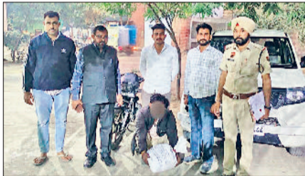
सिरसा। पकड़ा गया चूरापोस्त तस्क़र।

मोटरसाइकिल सवार व्यक्ति आता दिखाई दिया जो कि पुलिस टीम को देखकर वापस मुड़कर भागने की कोशिश करने लगा। पुलिस ने शक के आधार पर उसे काबू कर लिया और उसकी तलाशी ली तो उसके कब्जे