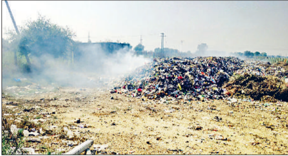
फतेहाबाद। कचरे में आग से उठ रहा जहरीला धुआं।

बढ़ते पर्यावरण प्रदूषण का सारा दोष धान की पराली जलाने वाले किसानों पर डाला जा रहा है। पॉल्यूशन कंट्रोल बोर्ड का इधर ध्यान ही नहीं है। दरअसल यह सारा काम स्टेट पॉल्यूशन कंट्रोल बोर्ड का है। बोर्ड पर्यावरण प्रदूषित करने वालों के खिलाफ कार्रवाई करने की बजाय सिर्फ उद्योगों व ईट भट्टों के ईट-गिटें