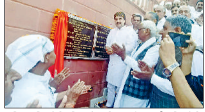
रतिया। बिश्नोई मंदिर लोकार्पण करते कुलदीप बिश्नोई।

रतिया। भाजपा के वरिष्ठ नेता एवं पूर्व सांसद कुलदीप बिश्नोई ने गुरुवार को फतेहाबाद जिले के रतिया में अनेक कार्यक्रमों में शिरकत की। इस दौरान उन्होंने नवनियमित गुरु जंभेश्वर मंदिर का लोकार्पण भी किया। मंदिर परिसर में श्रद्धालुओं को संबोधित करते हुए कुलदीप बिश्नोई ने कहा कि गुरु जंभेश्वर भगवान द्वारा बताए गए 29 नियम मानव जीवन का आधार हैं। समाज की एकजुटता ही सबसे बड़ी लाकत है, इसलिए सभी एकजुट होकर रहें। उन्होंने लोगों से आपसी भाईचारे व सहयोग की मांगना बनाए रखने का आह्वान किया। कुलदीप बिश्नोई ने कहा कि गुरु जंभेश्वर महाराज ने हमेशा सत्य, सेवा और पर्यावरण संरक्षण का संदेश दिया। हमें उनके दिखाए रास्ते पर चलकर समाज के हित में कार्य करना चाहिए। उन्होंने युवाओं को संदेश दिया कि अगर माता-पिता या साथियों को डेर की तरह काटकर फेंक देने, तो अंत पतन से भरा होगा, इसलिए मां-बाप की सेवा करें। आपस में भाईचारा व परेम बनाकर रहना चाहिए। संतों का एक-एक शब्द भक्तियों की तरह है।