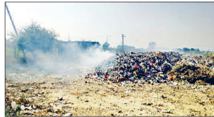
फतेहाबाद। खेतों में जलती पराली।