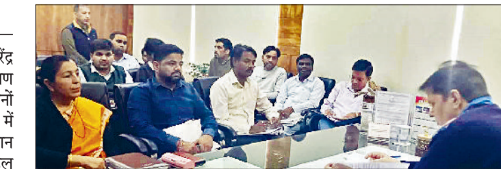
सिरसा। अधिकारियों की बैठक को संबोधित करते एडीसी।