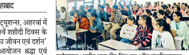
फतेहाबाद। शहीद बाबा दीप सिंह ग्रुप ऑफ इंस्टीट्यूट्स, अहरवा में आयोजित कार्यक्रम में उपस्थित विद्यार्थी।