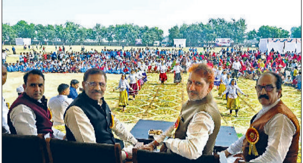
सिरसा। खेल महोत्सव में मौजूद राज्यसभा सांसद सुभाष बराला व अन्य अतिथि तथा मटका दौड़ में भाग लेती महिलाएं।

फिट युवा फॉर विकसित भारत कार्यक्रम के तहत सिरसा जिले के गांव बालासर के स्टेडियम में वीरवार को राज्यसभा सांसद सुभाष बराला ने खेल महोत्सव का शुभारंभ किया। सुभाष बराला ने कहा कि हरियाणा खिलाड़ियों की नर्सरी है। प्रदेश के सिरसा जिला ने भी हॉकी सहित कई खेलों में अंतरराष्ट्रीय खिलाड़ी दिए हैं। उचित मंच न मिलने के कारण अनेक ग्रामीण प्रतिभाएं उभर नहीं पाती और गलत दिशा की तरफ युवाओं को भटकता देख देश और प्रदेश की सरकार ने खेल पखवाड़ा आरंभ किया है। देश व प्रदेश में ब्लॉक स्तर पर खेल महोत्सव करवाए जा रहे हैं। विजेता खिलाड़ियों को विधानसभा, जिला और प्रदेश स्तर पर खेलने का मौका मिलेगा। उन्होंने कहा कि खेलों में भाग लेने से नौजवानों को सही दिशा मिलती है। पिछले कुछ