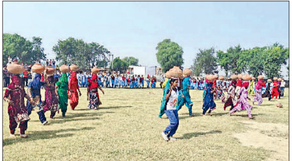
मटका दौड़ में भाग लेती महिलाएं।