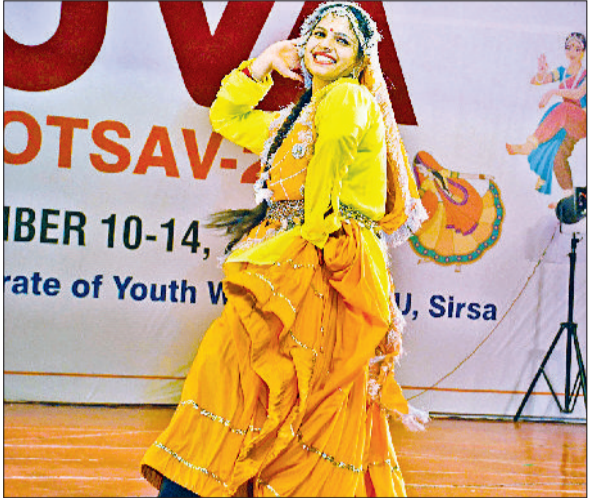
सिरसा। सीडीएलयू में आयोजित युवा महोत्सव में प्रस्तुति देती छात्रा।